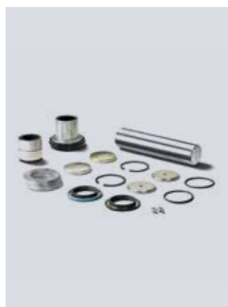
Sady pro opravu svislých čepů