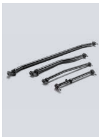
Spojovací tyče řízení